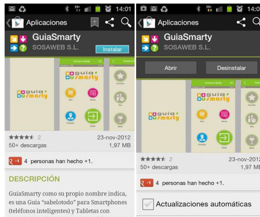
Pantalla de "Instalación" y de "Abrir la aplicación" una vez instalada GuíaSmarty desde Google Play

Si descargamos la aplicación desde Google Play , se nos habilita un botón donde se puede instalar la aplicación. Una vez finalizada la instalación de la misma, si no tenemos instalado anteriormente Adobe Air , se nos pregunta que si lo queremos instalar, a lo que debemos responder afirmativamente ya que es una aplicación imprescindible para instalar GuíaSmarty .