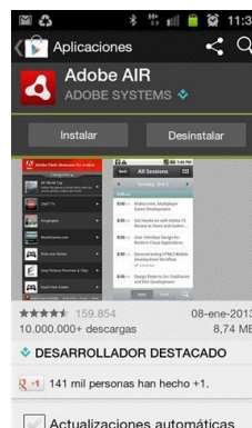
Pantalla de "Instalación" de Adobe Air, una vez instalada GuíaSmarty desde Google Play

Esta aplicación original de Adobe , se instala de idéntica forma que se acaba de instalar GuíaSmarty , primero comienza la descarga y de forma inmediata se habilita un botón para comenzar la instalación de la misma.