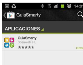
Resultado de la búsqueda de GuíaSmarty en Google Play

También podemos buscar en Google Play directamente, escribiendo GuíaSmarty y pulsando el botón existente de búsqueda. Localizada la aplicación, podemos pulsar Botón <Descarga>, que nos descargará la aplicación y luego la instalación de la misma.