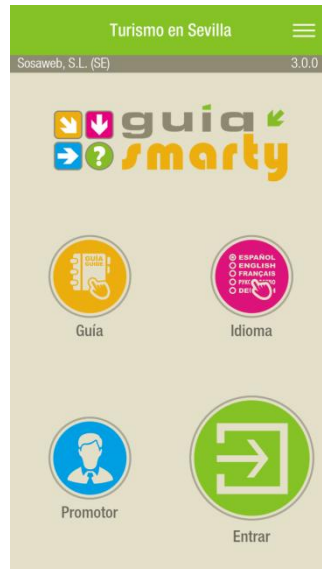
Pantalla de inicio de la aplicación GuíaSmarty

También tenemos tres botones desde donde podemos ver toda la información necesaria del Promotor de la Guía, como un botón donde podemos volver a seleccionar otra Guía y un botón para la selección del Idioma.