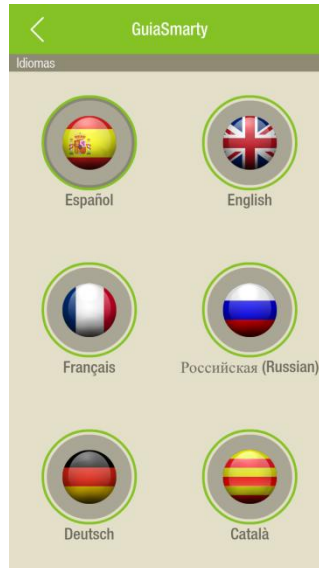
Pantalla de selección del Idioma de GuíaSmarty

Para ello existe una pantalla de la aplicación donde se nos muestra un listado con todos los idiomas disponibles. Una vez localizado el idioma, solo tenemos que seleccionarla y confirmar que es el que queremos utilizar.