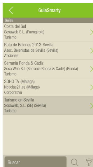
Pantalla de selección de la Guía de GuíaSmarty

Para ello existe una pantalla de la aplicación donde se nos muestra un listado con todas las guías que tenemos disponibles. Una vez localizada a la que queremos acceder solo tenemos que seleccionarla y confirmar que es la que queremos utilizar, como hemos hecho anteriormente con la selección del idioma.