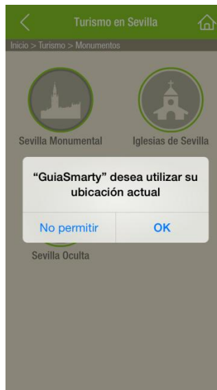
Pantalla donde se muestran los permisos necesarios para GuíaSmarty en iOS

Asimismo y como utilidad adicional, también podemos filtrar los Anunciantes por rango de distancia.